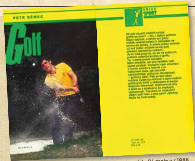
První moderní český psaná metodika golfu - vydala Olympia v r.1988 (za 3,50 Kčs)