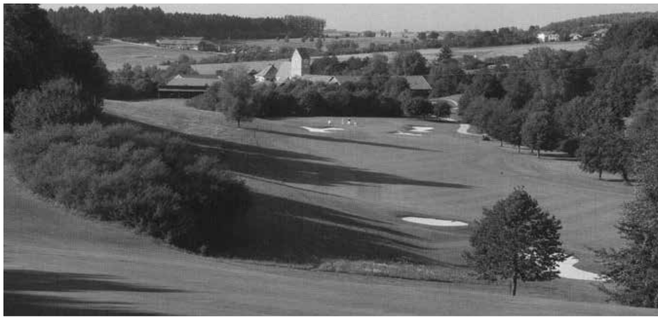
Krajina severozápadně od Bad Griesbachu – v popředí hřiště Uttlau, na obzoru hřiště Brunnwies, navržené B. Langerem.